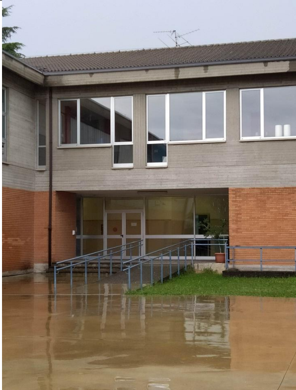
INGRESSO RETRO (VICINO AI BIDONI)