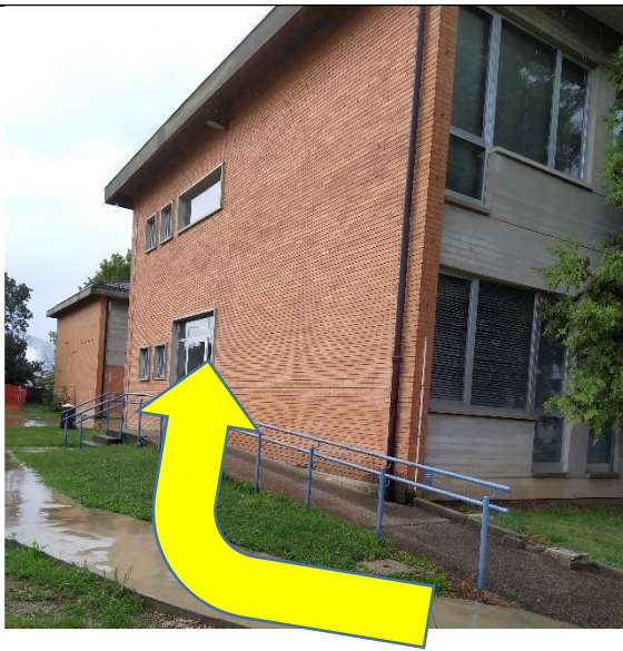
INGRESSO RETRO (VICINO ALLE RASTRELLIERE PORTABICI)